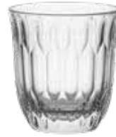
Cappuccino-/Flat-White-Glas Cappuccino/Flat white glass