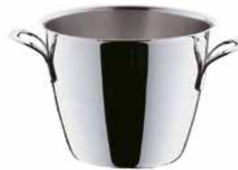
Eisgefäß ice bucket / seau à glace / cubo hielo / secchiello da ghiaccio