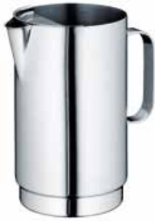
Eiswasserkrug water pitcher / carafe à l'eau / jarra agua / brocca per acqua mit Eislippe with ice-trap