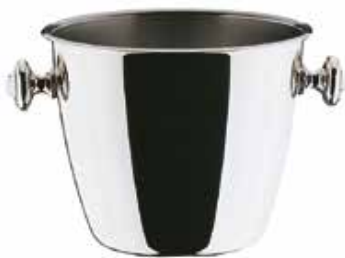
Eisgefäß ice bucket / seau à glace / cubo hielo / secchiello da ghiaccio mit Eiseinsatz with grid