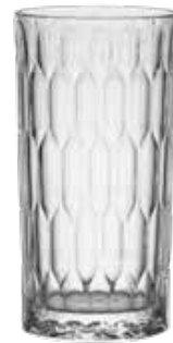
Latte-Macchiato-Glas Latte macchiato glass