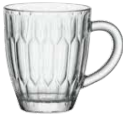
Kaffee-/Teeglas mit Henkel Coffee-/Tea glass with handle