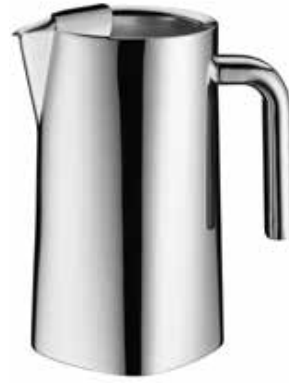
Eiswasserkrug Water pitcher / carafe à l'eau / jarra agua / brocca per acqua doppelwandig double-walled