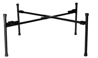
RÉHAUSSE POUR BUFFET GN 1/2 WCC363015BL 1/2 36 x 30 x 15 cm