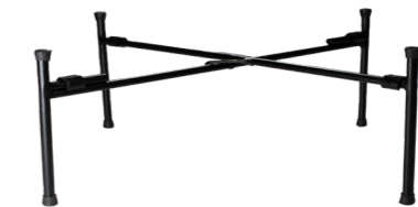
RÉHAUSSE POUR BUFFET GN 1/1 WCC57166BL 1/1 57 x 36 x 6 cm