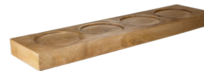
SUPPORT POUR BUFFET EN BOIS DE MANGUE POUR 4 PRÉSENTOIRES WCC5213 52,5 X 13 X 4 cm