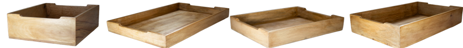
BAC À BUFFET EN DE BOIS MANGUE GN 1/2 WCC352912 1/2 35 x 29 x 12 cm