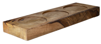
SUPPORT POUR BUFFET EN BOIS DE MANGUE POUR 3 PRÉSENTOIRES WCC4013 40 x 13 x 4 cm