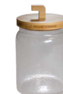
POT AVEC BULLES TRANSPARENTES, COUVERCLE INCLUS GB1000 14 x 14 x 16 cm