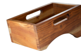
BAC À COUVERTS EN ACACIA WCC2816 28,5 x 16,5 x 15 cm