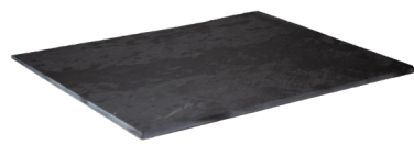
PLATEAU DE PRÉSENTATION EN ARDOISE GN SL5332 1/1 53 x 32,5 x 0,7 cm SL3226 1/2 32,5 X 26,5 X 0,7 cm