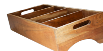
BAC À COUVERTS EN ACACIA WCC5728 57 x 28 x 15 cm