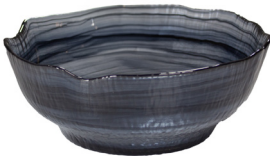
ASSIETTE EN VERRE CREUSE AVEC REBORDS FORME ORGANIQUE, TOURBILLON NOIR SW1024 Ø 21,5 cm