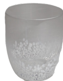
VERRE OVAL TRANSPARENT TACHES BLANCHES SG1000