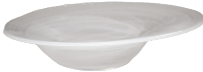
ASSIETTE EN VERRE INCLINÉE 25CM, TOURBILLON BLANC SW1006