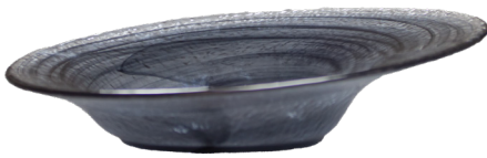
ASSIETTE EN VERRE INCLINÉE 25CM, TOURBILLON NOIR SW1026