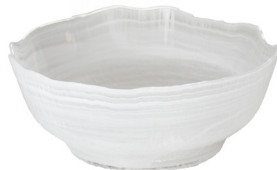
ASSIETTE EN VERRE CREUSE AVEC REBORDS FORME ORGANIQUE, TOURBILLON BLANC SW1004 Ø 21,5 cm