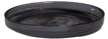
ASSIETTE EN VERRE AVEC REBORD, EMPILLABLE, TOURBILLON NOIR SW2310 Ø 25,4 cm SW1020 Ø 22 cm SW1027 Ø 16 cm