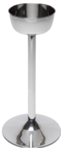
G . Support seau à champagne