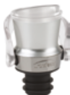
F . Bouchon et bec verseur 2 en 1