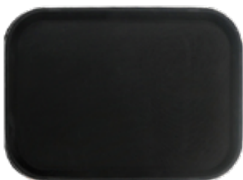
E . Rectangle