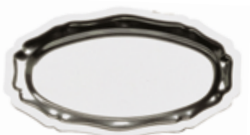
G . Ovale