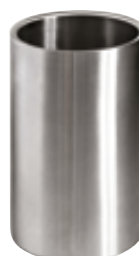
C . Glacette inox 18%