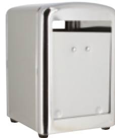
E . Distributeur inox à serviettes