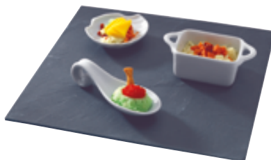
I . Forme carrée