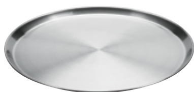
C . Barman rond inox soigné