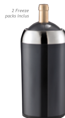
D . Refroidisseur à vin