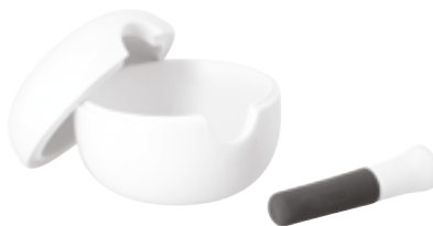
I . Mortier et pilon