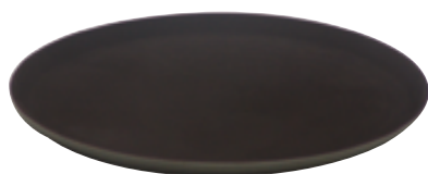
D . Rond