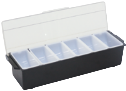
A . Boîte ingrédients + 6 compartiments