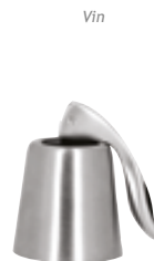
V . Chromé