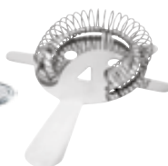
I . Passoire à cocktail