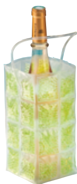
A . Bleu / vert

Garantie de conserver votre bouteille au frais plus longtemps. Idéal pour les repas en terrasse, à l'extérieur, les apéritifs ou les pique-niques.