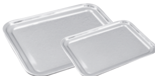
E . Rectangulaire inox 18.0