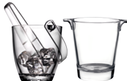
E . Highland

Idéal pour présenter et servir vos glaçons à table. Simples d'entretien puisqu'ils passent au lave vaisselle.