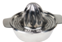
J . Inox