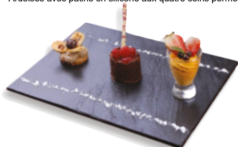
H . Forme rectangle

Ardoises avec patins en silicone aux quatre coins permettant l'empilage.