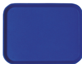
B . Fast food polypropylène bleu