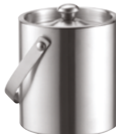
K . Inox isotherme