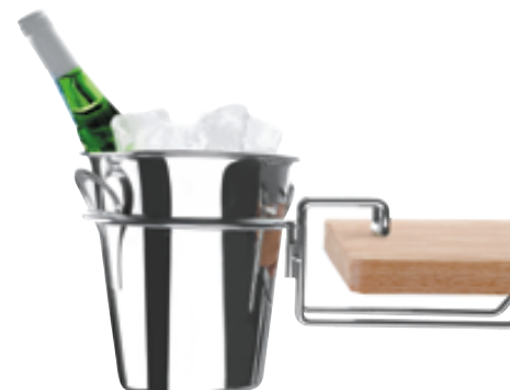
L . Support seau à champagne