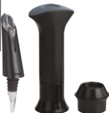
K . Le coffret