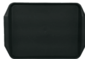
C . Plateau poignée noir