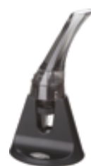
H . Arom + support