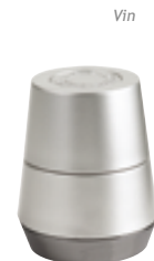
X . Expansible