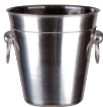
B . Seau à anneaux