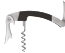
J . Sommelier