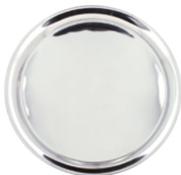
D . Barman rond inox standart