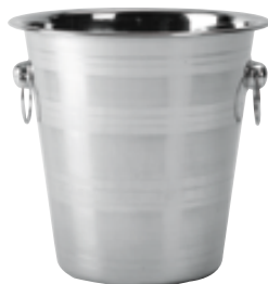
J . Avec anneaux