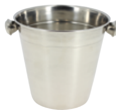
D . Seau à anses