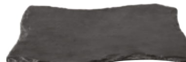
K . Forme ondulée