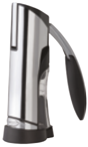
A . Base magnétique