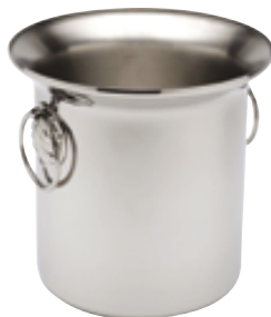
C . Seau à anneaux