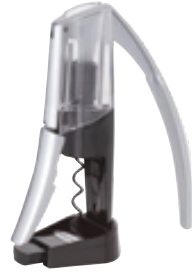
B . Base coupe capsule