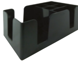
B . Bar caddy 6 compartiments