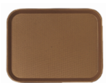
A . Fast food polypropylène brun