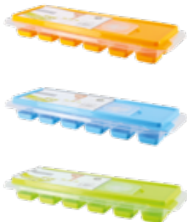
H . Silicone Orange / Bleu / Vert

Fait de porcelaine, cet ensemble est solide et robuste. ! Le manchon en silicone sur le pilon vous permet une prise en main ferme.