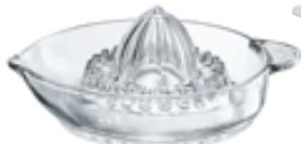
H . Presse agrumes en verre