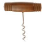
K . Tonneau bois