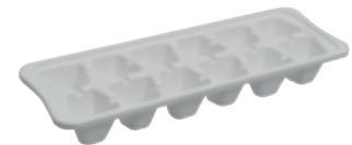
G . Plastique