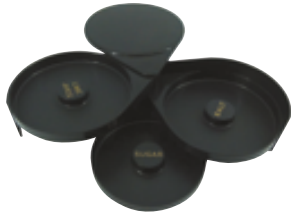
D . Nécessaire à givrer 3 plateaux