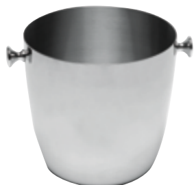
I . Lourd