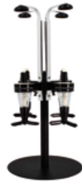
C . Distributeur boissons 4 bouteilles (mode d'emploi fourni)