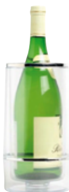
B . Acrylique