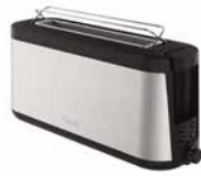
Toaster „ELEMENT“ Toaster „ELEMENT“