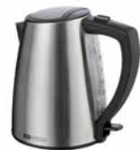
Wasserkocher Fashion steel 1,2 l Kettle Fashion steel 1.2 l