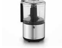
WMF KÜCHENminis Zerkleinerer WMF KITCHENminis Chopper