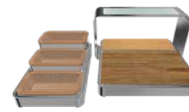
Modul 04 · Module 04 55.0305.9900