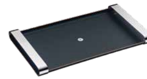
Tablett CLUB eckig schwarz Serving tray CLUB oblong black