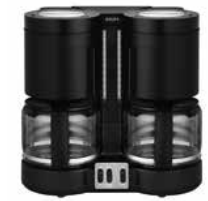
Kaffeeautomat Duotheek KT8501 Coffeemachine Duotheek KT8501