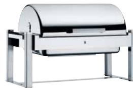
WMF CHANGE, rund oder im GN-Format. WMF CHANGE, round or in GN format.

Even with their big range, WMF chafing dishes have one thing in common: They are both attractive and functional. The new models with black powder coating set striking accents at the buffet. All models are really easy to use. From simple one-handed operation of the lid to the condensation return system. In various sizes and designs, with comprehensive accessories for flexible use at the buffet.