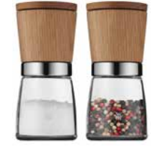
Gewürzmühle NATURE, 2-tlg., unbefüllt Spice mill NATURE 2-pc, unfilled