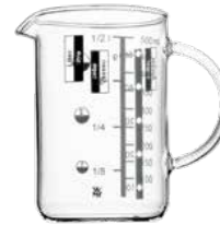
Messbecher 0,5 l Measure 0.5 l