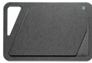
Schneidebrett 45 x 30 cm Cutting board 45 x 30 cm