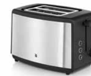
WMF BUENO Toaster Edition WMF BUENO Toaster Edition