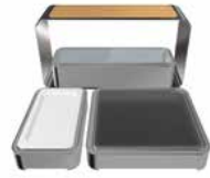
Modul 64 · Module 64 55.0319.9900