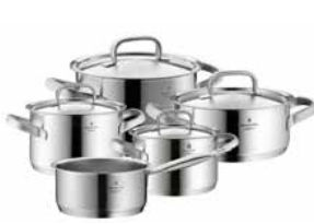
Topf-Set GOURMET PLUS 5-tlg. Cookware set GOURMET PLUS 5-pc