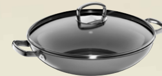
Fusiontec Mineral Wok mit Glasdeckel, 36 cm Fusiontec Mineral Wok with lid, 36 cm