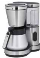
WMF LONO Aroma Kaffeemaschine Thermo WMF LONO Aroma Coffee Maker Thermo