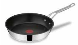
Jamie Oliver Cook's Classic Pfanne 28 cm Jamie Oliver Cook's Classic pan 28 cm