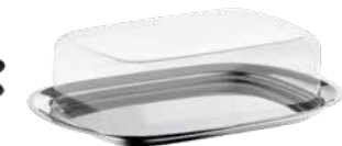
Butterdose Butter dish