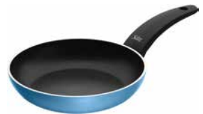
Stielpfanne Belluna BLAU 20 cm Fry pan Belluna blue 20 cm