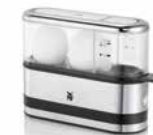
WMF KÜCHENminis 2-Eier-Kocher WMF KITCHENminis 2-Egg Boiler