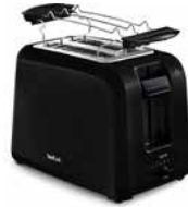
TEFAL VITA Toaster Schwarz TT1A28 TEFAL VITA Toaster black TT1A28