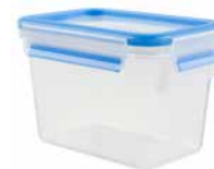
Frischhaltedose rechteckig, Hochformat „CLIP & CLOSE“ Food storage container, rectangular, portrait format „CLIP & CLOSE“

transparent/blau, 100 % dicht, 100 % hygienisch, 100 % unbedenklich, integrierte Mengenskala, spülmaschinenfest, gefriergeeignet, mikrowellengeeignet (Deckel nur lose auflegen - max. 1,5 min. bei 600 W) transparent/blue, 100% leak-proof, 100% hygienic, 100% safe, integrated measuring scale, dishwasher safe, freezer safe, microwave safe (simply place the lid loosely on the top - max. 1.5 min. at 600 W)