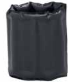
WMF AMBIENT Wein-Kühlelement WMF AMBIENT wine cooling element

konzipiert zur Verwendung mit WMF AMBIENT Sekt- und Weinkühler, für Flaschen mit Ø bis 9,2 cm designed for use with WMF AMBIENT champagne and wine cooler, for bottles with Ø up to 9.2 cm