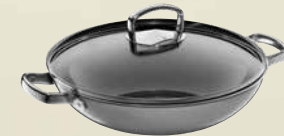
Fusiontec Mineral Wok mit Glasdeckel, 32 cm Fusiontec Mineral Wok with lid, 32 cm