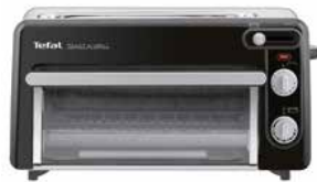
Tefal Toast & Grill Tefal Toast & Grill