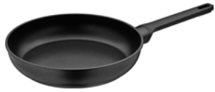
Stielpfanne PermaDur Excell 28 cm Fry pan PermaDur Excell 28 cm