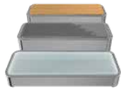
Modul 62 · Module 62 55.0317.9900