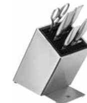
FlexTec-Messerblock bestückt GRAND GOURMET 6-tlg. FlexTec knife block with knives GRAND GOURMET 6-pc