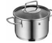
Fleischtopf ASTORIA 16 cm mit Deckel