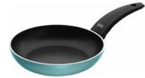
Stielpfanne Belluna GRÜN 20 cm Fry pan Belluna green 20cm