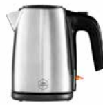
Wasserkocher „CENTRIC“ 1,0 l Kettle „CENTRIC“ 1.0 l