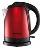
Wasserkocher SUBITO 1,7 l Kettle SUBITO 1.7 l