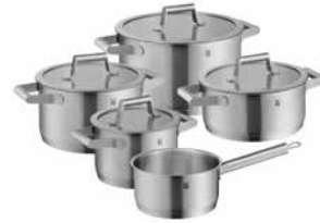
WMF Topf-Set 5-tlg. COMFORT LINE WMF pan-set 5 pcs COMFORT LINE