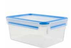
Frischhaltedose rechteckig, Großformat „CLIP & CLOSE“ Food storage container, rectangular, large format „CLIP & CLOSE“

transparent/blau, 100 % dicht, 100 % hygienisch, 100 % unbedenklich, integrierte Mengenskala, spülmaschinenfest, gefriergeeignet, mikrowellengeeignet (Deckel nur lose auflegen - max. 1,5 min. bei 600 W) transparent/blue, 100% leak-proof, 100% hygienic, 100% safe, integrated measuring scale, dishwasher safe, freezer safe, microwave safe (simply place the lid loosely on the top - max. 1.5 min. at 600 W)