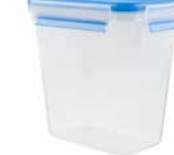
Frischhaltedose rechteckig, Hochformat „CLIP & CLOSE“ Food storage container, rectangular, portrait format „CLIP & CLOSE“

transparent/blau, 100 % dicht, 100 % hygienisch, 100 % unbedenklich, integrierte Mengenskala, spülmaschinenfest, gefriergeeignet, mikrowellengeeignet (Deckel nur lose auflegen - max. 1,5 min. bei 600 W) transparent/blue, 100% leak-proof, 100% hygienic, 100% safe, integrated measuring scale, dishwasher safe, freezer safe, microwave safe (simply place the lid loosely on the top - max. 1.5 min. at 600 W)