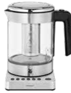
WMF KÜCHENminis Glas-Wasserkocher Vario 1,0 l WMF KITCHENminis Glass-Kettle Vario 1.0 l