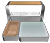
Modul 75 · Module 75 55.0320.9900