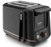
Tefal Toaster INCLUDEO Tefal Toaster INCLUDEO