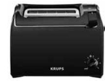
Toaster „PROAROMA“ KH1518 Toaster „PROAROMA“ KH1518