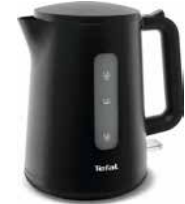
Wasserkocher „PRINCIPIO SELECT“ 1,7 l Kettle „PRINCIPIO SELECT“ 1.7 l