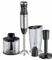
WMF KULT X Stabmixer-Set WMF KULT X Stick Blender Set