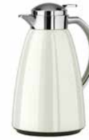
Isolierkanne „CAMPO“, Weiß 1,0 l Vacuum jug „CAMPO“, white, 1.0 l

Quick-Tip-Verschluss, mit hochwertigem Glas-Isolierkolben, 100 % dicht, komfortable Einhandbedienung Quick Tip closure, with high-quality glass liner, 100% leak-proof, comfortable single-handed operation