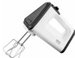
KRUPS Handmixer 3-MIX-5500 weiß KRUPS Hand Mixer 3-MIX-5500 white