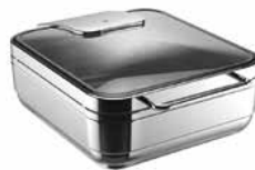
WMF HOT & FRESH, induktionsgeeignet. WMF HOT & FRESH, suitable for induction use.