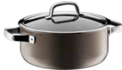
Fusiontec Mineral Bratentopf mit Glasdeckel, Dark Brass

Fusiontec Mineral Braising Pan with lid, Dark Brass