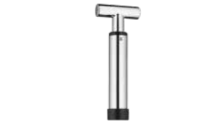
Weinpumpe mit 2 Verschlüssen VINO Wine pump with 2 stoppers VINO