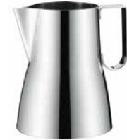
Krug für Milchschaum Milk frothing mug / pitcher