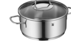
Bratentopf ASTORIA 20 cm mit Deckel