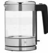
WMF KÜCHENminis Glas-Wasserkocher 1,0 l WMF KITCHENminis Glass-Kettle 1.0 l