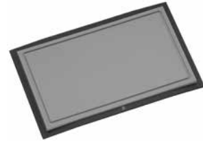
Schneidebrett 32 x 20 cm schwarz Cutting board 32 x 20 cm black