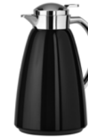
Isolierkanne „CAMPO“, Anthrazit 1,0 l Vacuum jug „CAMPO“, anthracite, 1.0 l

Quick-Tip-Verschluss, mit hochwertigem Glas-Isolierkolben, 100 % dicht, komfortable Einhandbedienung Quick Tip closure, with high-quality glass liner, 100% leak-proof, comfortable single-handed operation