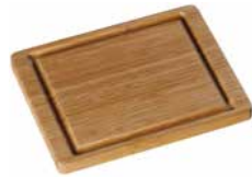
Schneidebrett Bambus 26 x 20 cm Bamboo cutting board 26 x 20 cm