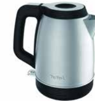
Wasserkocher „ELEMENT“ 1,7 l Kettle „ELEMENT“ 1.7 l