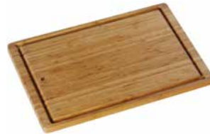
Schneidebrett Bambus 45 x 30 cm Bamboo cutting board 45 x 30 cm