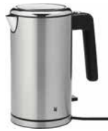
WMF LONO Doppelwandiger Wasserkocher 1,3 l WMF LONO Doublewalled Kettle 1.3 l