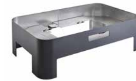
Buffetgestell GN 1/1, schwarz, HOT & FRESH