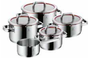
WMF Topf-Set 5-tlg. FUNCTION 4 WMF Pan-set 5 pcs FUNCTION 4