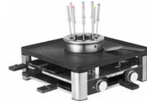
WMF CE Lumero Gourmet-Station 3-in-1 WMF CE Lumero Gourmet station 3-in-1