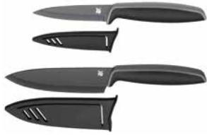
Messerset Touch 2-tlg. schwarz Set of kitchen knives Touch 2-pc black