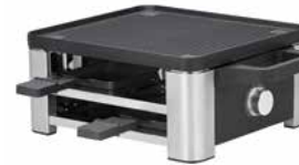
WMF LONO Raclette für 4 WMF LONO Raclette for 4