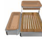
Modul 06 · Module 06 55.0306.9900