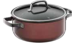
Fusiontec Mineral Bratentopf mit Glasdeckel, Rose Quartz

Fusiontec Mineral Braising Pan with lid, Rose Quartz