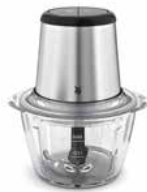
WMF KULT X Zerkleinerer Edition WMF KULT X Chopper Edition