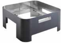
Buffetgestell GN 2/3, schwarz, HOT & FRESH buffet stand GN 2/3, black, HOT & FRESH

Höhe inkl. Chafing Dish 30 cm, pulverbeschichtet schwarz height inclusive chafing dish 11 3/4 in., powder coated black