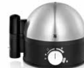
WMF STELIO Eierkocher WMF STELIO Egg cooker