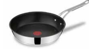
Jamie Oliver Cook's Classic Pfanne 24 cm Jamie Oliver Cook's Classic pan 24 cm