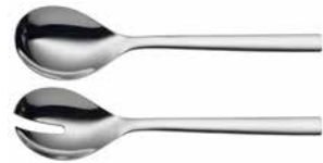
Salatbesteck NUOVA Salad servers NUOVA