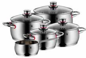
Kochgeschirr-Set Quality One 5-tlg. Cookware set Quality One 5-pc