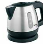
Tefal Wasserkocher „MINI“ 0,8 l Tefal Kettle „MINI“ 0.8 l