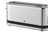
WMF KÜCHENminis Langschlitz-Toaster WMF KITCHENminis Long Slot Toaster