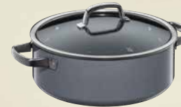
Fusiontec Mineral Bratentopf mit Glasdeckel, 28 cm Fusiontec Mineral Braising Pan with lid, 28 cm