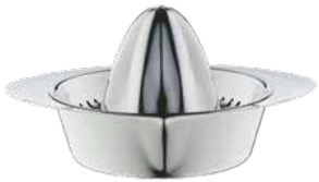
Zitronenpresse Lemon squeezer