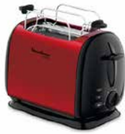
Moulinex subito red Toaster Moulinex subito red Toaster