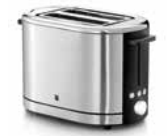
WMF LONO Toaster WMF LONO Toaster