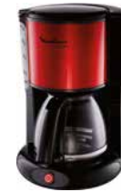
Moulinex Subito red Kaffeemaschine Moulinex Subito red coffee machine