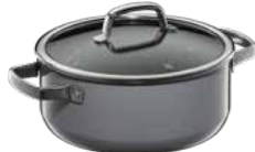
Fusiontec Mineral Bratentopf mit Glasdeckel, Platinum

Fusiontec Mineral Braising Pan with lid, Platinum