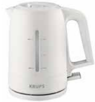
Wasserkocher „PROAROMA“ weiß 1,6 l Kettle „PROAROMA“ white 1.6 l