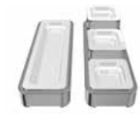
Modul 51 · Module 51 55.0315.9900