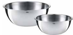
Küchenschüssel-Set 2-tlg. Kitchen bowl set 2-pc