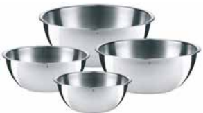
Küchenschüssel GOURMET Set 4-tlg. Kitchen bowl set GOURMET 4-pc