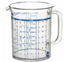
Messbecher 1,0 l Measuring cup 1,0 l