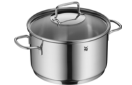
Fleischtopf ASTORIA 20 cm mit Deckel