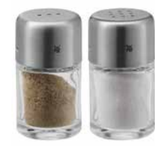
Salz-/Pfeffer-Set BEL GUSTO Salt-pepper-set BEL GUSTO