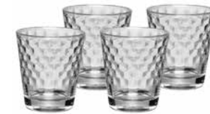
Tumbler im Honeycomb-Design, Set 4-tlg. Tumbler set, 4-pc, Honeycomb design