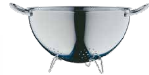
Salatseihier GOURMET 24 cm Salad strainer GOURMET 24 cm