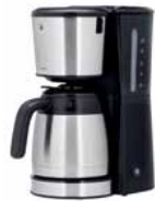
WMF BUENO PRO Kaffeemaschine Thermo WMF BUENO PRO Coffee Maker Thermo