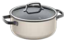
Fusiontec Mineral Bratentopf mit Glasdeckel, Macadamia

Fusiontec Mineral Braising Pan with lid, Macadamia