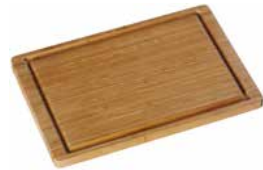
Schneidebrett Bambus 38 x 25 cm Bamboo cutting board 38 x 25 cm