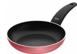
Stielpfanne Belluna ROSÉ 20 cm Fry pan Belluna rosé 20 cm