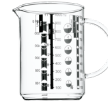
Messbecher 1,0 l Measure 1.0 l