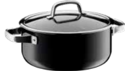
Fusiontec Mineral Bratentopf mit Glasdeckel, Black

Fusiontec Mineral Braising Pan with lid, Black