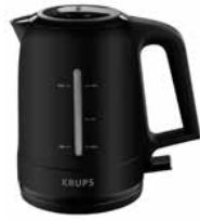
Wasserkocher „PROAROMA“ BW2448 1,6 l Kettle „PROAROMA“ BW2448 1.6 l