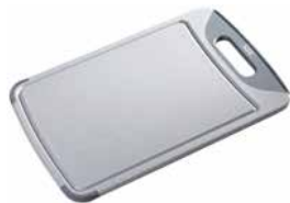
Schneidebrett 32 x 20 cm grau Cutting board 32 x 20 cm grey