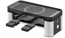
WMF KÜCHENminis Raclette für 2 WMF KITCHENminis Raclette for 2