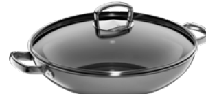
Fusiontec Mineral Wok mit Glasdeckel, Platinum

Fusiontec Mineral Wok with lid, Platinum