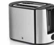
WMF BUENO PRO Toaster WMF BUENO PRO Toaster