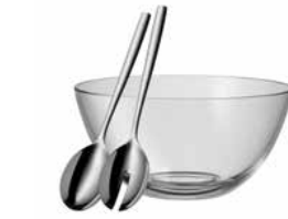
Salat-Set Taverno 3-tlg. klein Taverno salad set, 3-pc, small