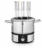
WMF LONO Fondue-Set WMF LONO fondue