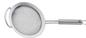
Brühsieb PROFi PLUS 16 cm Broth colander PROFi PLUS 16 cm