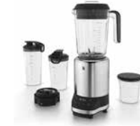
WMF KULT PRO Multifunktionsmixer WMF KULT PRO Multifunctional Blender