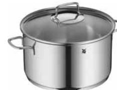
Fleischtopf ASTORIA 24 cm mit Deckel