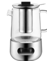
Teekanne m. Teesieb u. Stövchen SensiTea Tea pot with tea strainer and Rechaud SensiTea