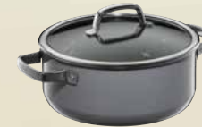
Fusiontec Mineral Bratentopf mit Glasdeckel, 24 cm Fusiontec Mineral Braising Pan with lid, 24 cm