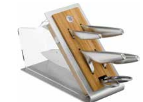
Messerblock bestückt Chef's Edition 6-tlg. Knife block with knives Chef's Edition 6-pc