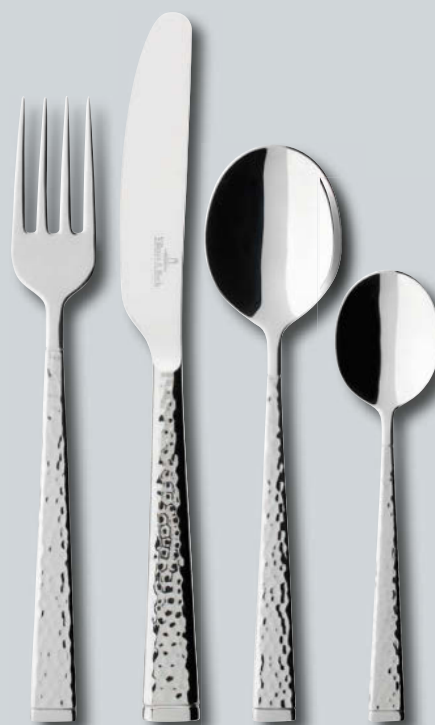
Blacksmith p. 208 – 209

Pregiato materiale, attraente design, perfetta lavorazione – è ovvio che la Villeroy & Boch fornisce posate di prima classe, perfettamente adatte all'impiego professionale nella tavola della vostra struttura ricettiva. Tutte le posate in acciaio.