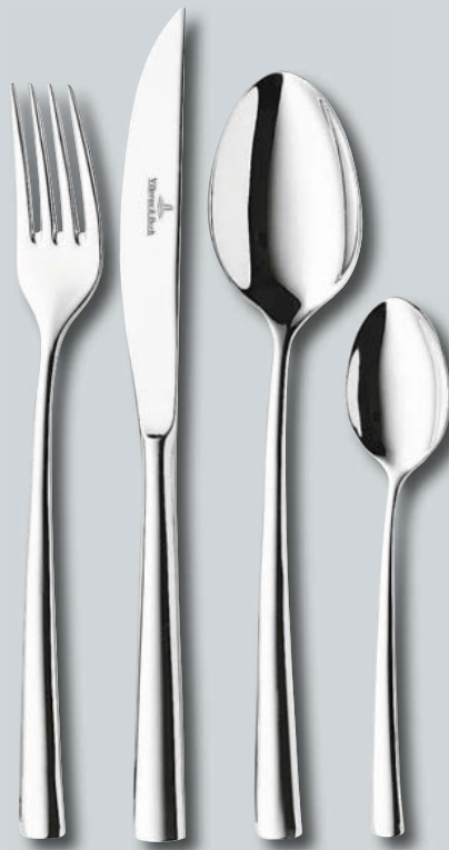
Piemont p. 224 – 225