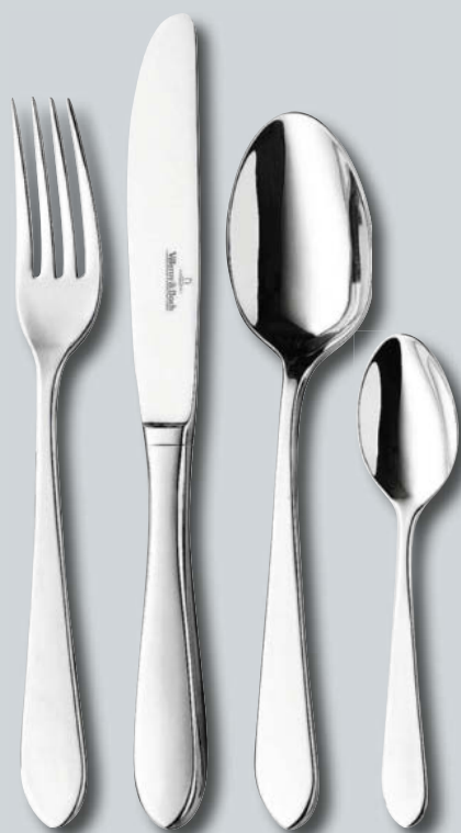
Sereno p. 226 – 227