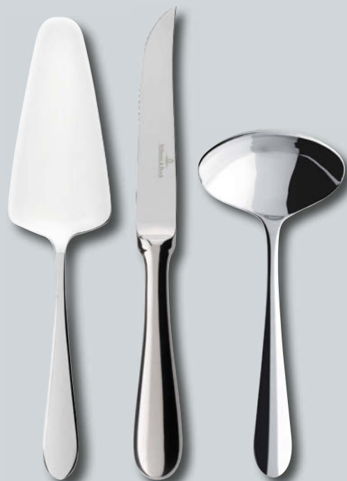
Universal p. 232 – 233

Cutlery, stainless steel, dishwasher-safe - Couverts, acier inoxydable, garantie lave-vaisselle - Besteck, Edelstahl, spülmaschinenfest - Cubertería, acero inoxidable, garantizada al lavavajillas - Posate, acciaio, inalterabile in lavastoviglie