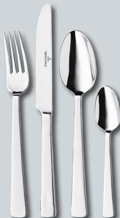
Notting Hill p. 220 – 221