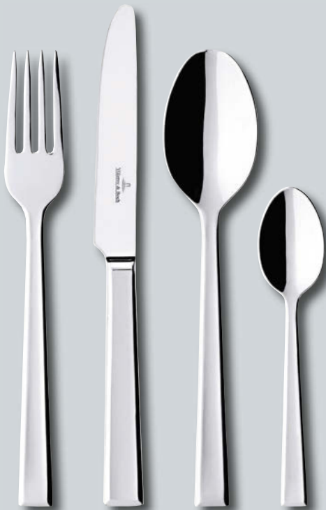
Victor p. 230 – 231