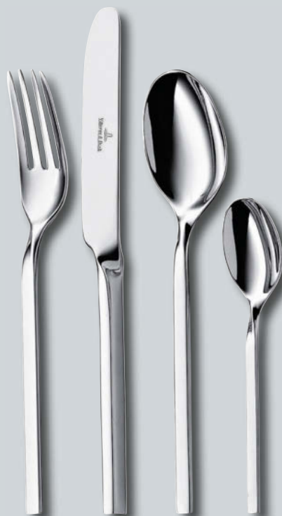
NewWave p. 218 – 219

Cutlery, stainless steel, dishwasher-safe · Couverts, acier inoxydable, garantie lave-vaisselle · Besteck, Edelstahl, spülmaschinenfest · Cubertería, acero inoxidable, garantizada al lavavajillas · Posate, acciaio, inalterabile in lavastoviglie