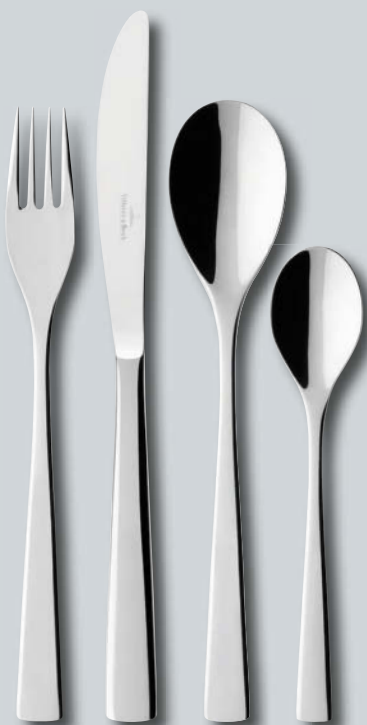
Modern Line p. 216 – 217