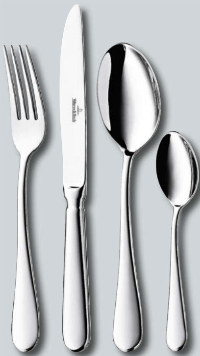
Oscar p. 222 – 223