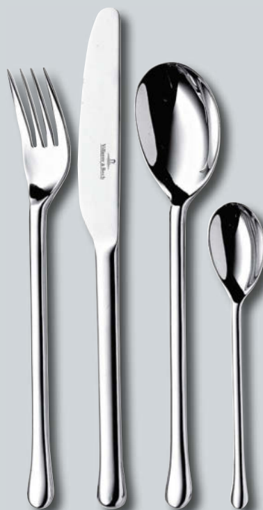
Udine p. 228 – 229

Subject to change - Modifications possibles - Änderungen vorbehalten Salvo error - Con riserva di modifica