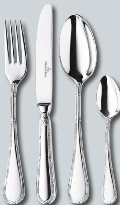
Kreuzband p. 214 – 215

Subject to change - Modifications possibles - Änderungen vorbehalten Salvo error - Con riserva di modifica