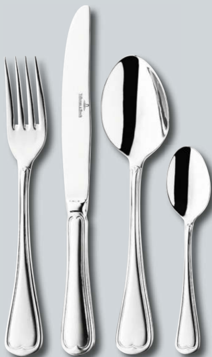
Bourgogne p. 210–211