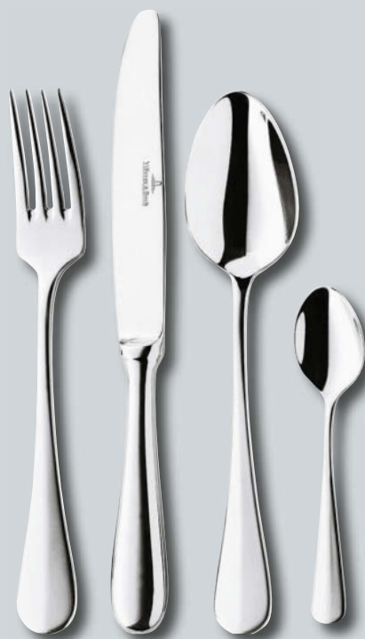
Coupole p. 212 – 213