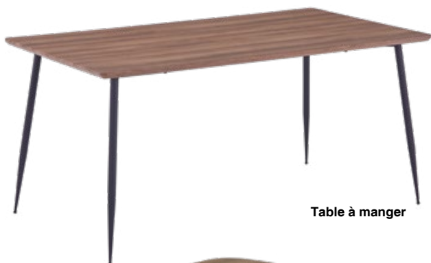
Table à manger