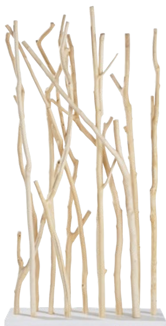
Séparation en Teck