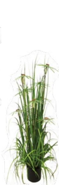
Graminée à fleurs