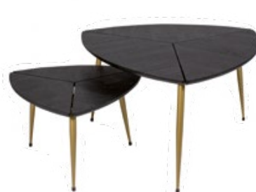
2 tables basses