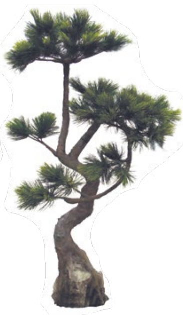
Pin du japon grd