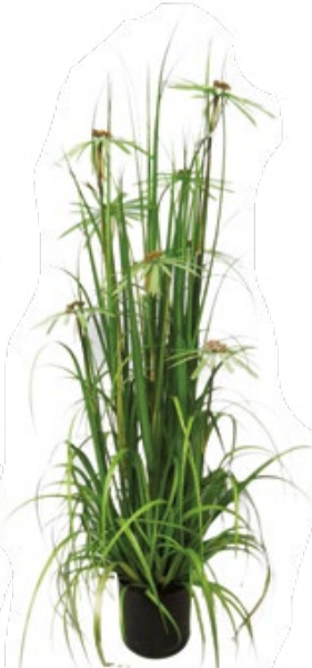
Graminée à fleurs