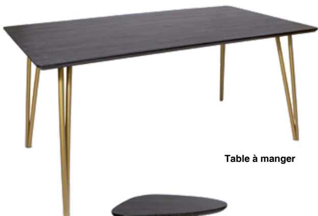
Table à manger

Table en bois noir avec pieds en métal doré mat.