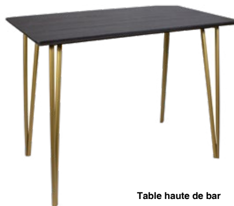
Table haute de bar