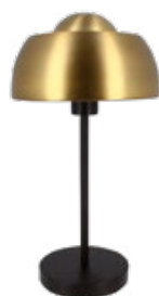
Lampe à poser