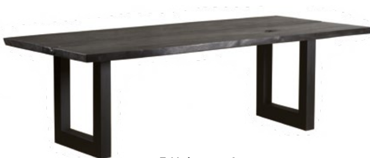
Table à manger 3m