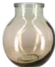
Vase Aran Taupe