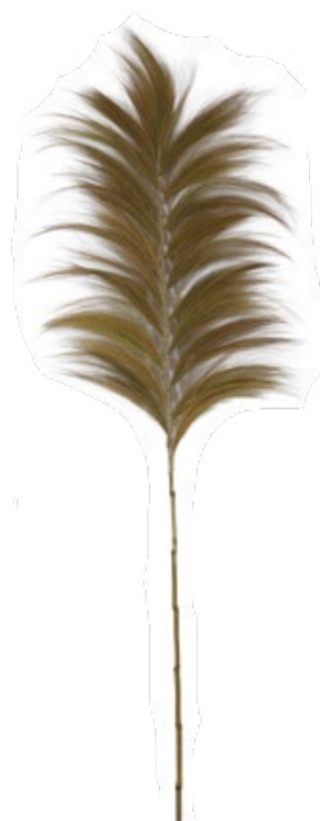
Koh Rang beige