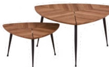
2 tables basses