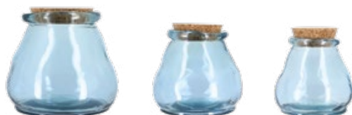
Pot couvercle liège

Le design, la qualité sont parfaitement possibles avec du verre 100% recyclé.