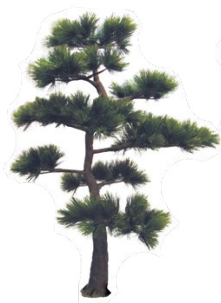
Pin du japon