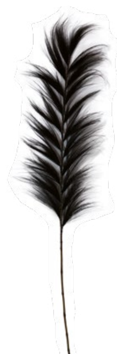
Koh Rang noire