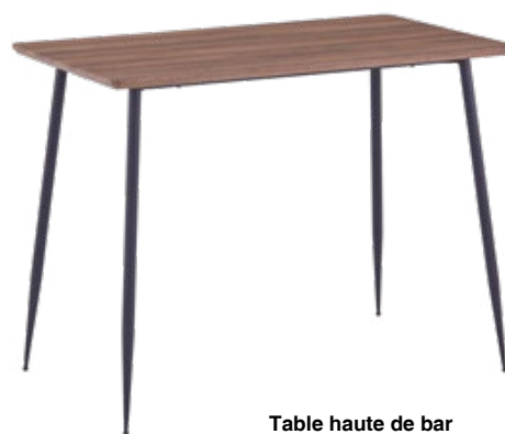
Table haute de bar