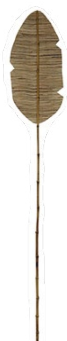
Feuilles Koh Mak